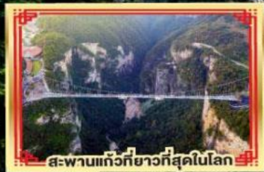
สะพานแกว่ที่ยาวที่สุดในโลก