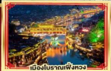
เมืองโบราณเฟิงหวง