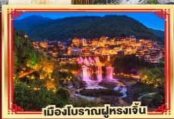
เมืองโบราณฟูหรงเจิน